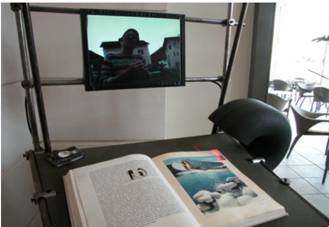
Durch Umblättern werden die Video-Geschichten aufgerufen