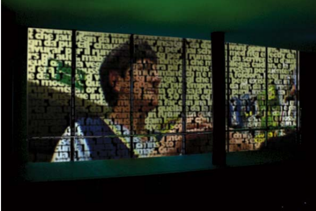
Verwebung der medialen Ebenen: Durch den Text wird das Bild sichtbar

Medienarchäologie: Ein Fundstück, ein altes Buch wird zum interaktiven Video-Player