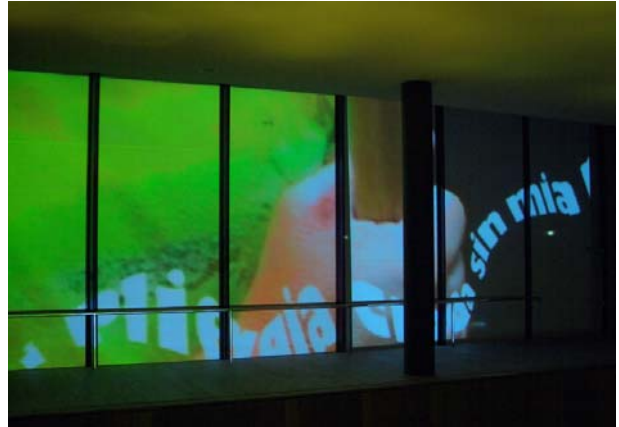
Ein „Textwurm“ sucht Anschluss an seine Geschichte